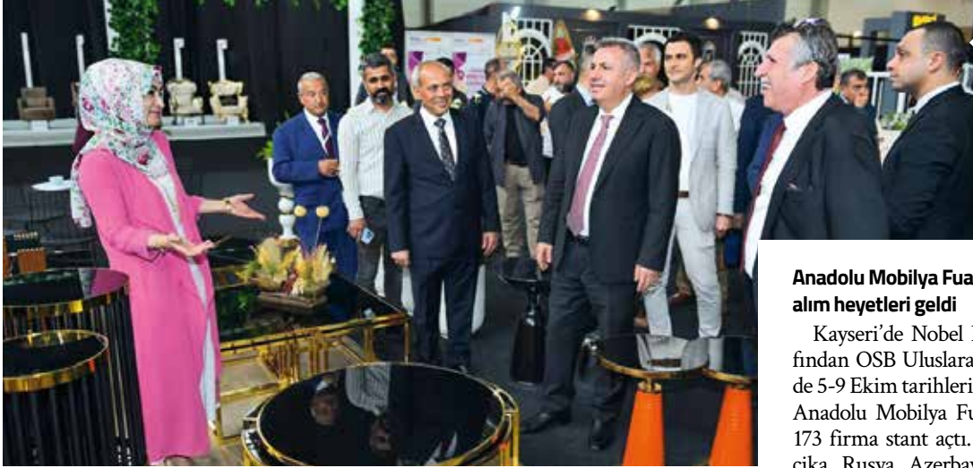
13. Çukurova Mobilya Dekorasyon Fuarı'nda modern ve avangart mobilya tasarımları öne çıktı.