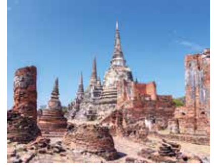
Tayland, 2022 yılı itibarıyla 196 ülke arasında dünyanın 28'inci büyük ekonomisi olarak gösteriliyor.

kaydırmaya yönelik planlamalar yapıyor. 2021 yılında 1,7 milyon motorlu taşıt üreten Tayland'da Japonya, ABD, Avrupa ve Çin merkezli 25 şirketin üretim tesisi bulunuyor. Tekstil sektöründe tüm değer zincirini barındıran Tayland, 4 bin 700'den fazla yerel üreticisiyle sentetik elyaf üretiminde ileri durumda bulunuyor. Hazır giyimde 2 bin 100 üreticiye sahip Tayland; Nike, Adidas, GAP gibi markaların fason üretimini yapıyor. Kadın ve erkek giyimde toplam pazarın 6,1 milyar dolar düzeyinde olduğu öngörülüyor.