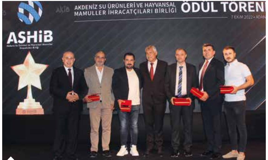
Adana ilinden 2021 yılında en fazla ihracat gerçekleştiren ilk beş firmanın temsilcileri, ödüllerini Adana Büyükşehir Belediye Başkanı Zeydan Karalar'ın elinden aldı.

gelir kaynaklarını artırmaya yönelik bu konuda sizlerin de hassasiyet göstermesini bekliyorum, 01 Adana'ya, Marka Kent Adana'ya desteklerinizin devam edeceğine canı gönülden inanıyorum. Adana'da yerleşik dış ticaret firmaları ithalat işlemlerinin tamamını kentimizde yaparsa, belediyemizin sağlayacağı gelir, yol, su, köprü, kanalizasyon ve diğer altyapı yatırımları olarak kendilerine geri dönecektir."