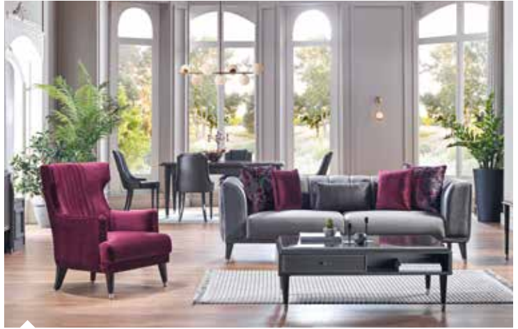
Endüstriyel üretim yapan Bellona, 52 saniyede bir kanepede, 58 saniyede bir yatak, 38 saniyede bir baza üretiyor.

eden Rusya’da Almanya, İtalya ve İspanya pazardan çekildi. Çok uluslu bir şirket olan IKEA, Moskova’daki çok büyük yerleşkesini boşalttı. Rusya pazarından çıkan Avrupalı satıcıların yerini Türk firmaları doldurmaya başladı. Bellona olarak Rusya’da ikinci distribütörü devreye soktuk ve bu ülkeden ciddi miktarda siparişler almaya başladık. Rusya pazarında satışlar güzel gidiyor, kârlılık iyi, keyifli bir durum var. Rusya’ya sektör ihracatımız, bu yılın ilk 8 ayında yüzde 125,8’lik artışla 108 milyon doları aşmış durumda. Bu ivmenin devam etmesini öngörüyoruz.”