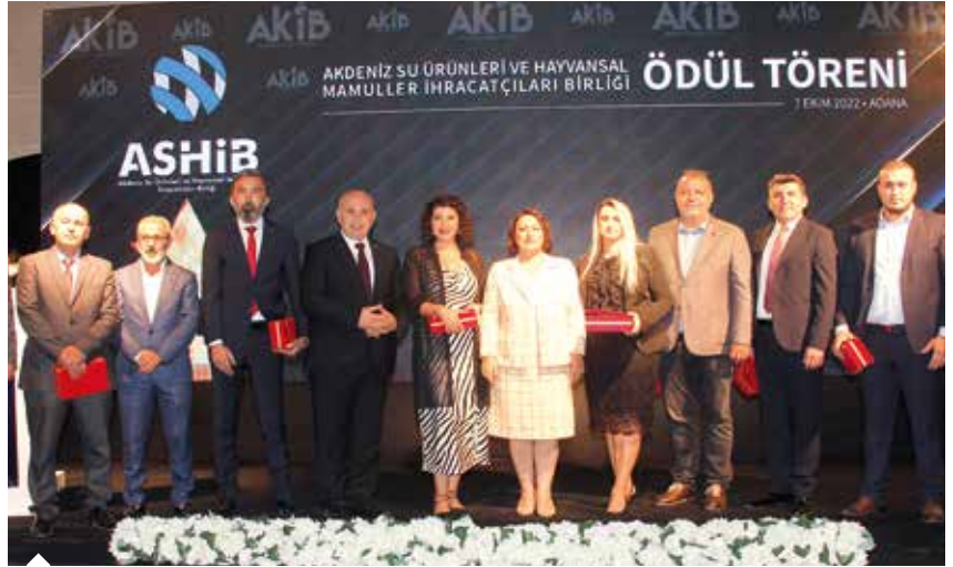
CHP Adana Milletvekili Müzeyyen Şevkin, ASHİB üyeleri arasında 2021 yılında Adana ilinden en fazla ihracat gerçekleştiren firmaların temsilcilerini tebrik edip, ödüllerini verdi.